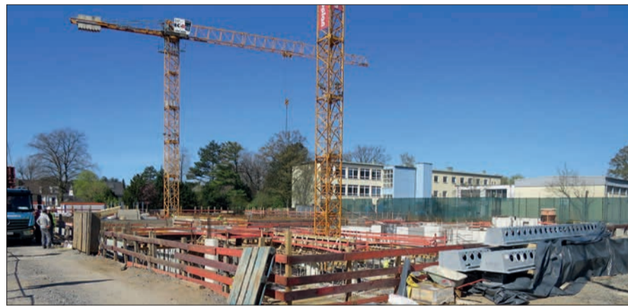
Die Baustelle des Wohnprojekts „K450“ an der Kaiserswerther Straße. Die GGS Beckbuschstraße im Hintergrund.

Es wird auf beiden Baustellen zwar zügig gearbeitet, Bezugsstermine zu nennen, dürfte derzeit aber sehr gewagt sein. H.S.