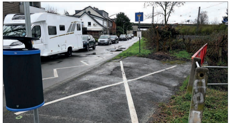
In 2024 soll diese Straßenbrücke über den Rahmer Bach An der Huf in Rahm neu gebaut werden.