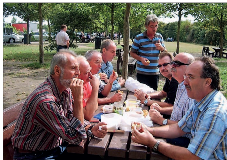
Im Jahr 2009 fuhren die Sermer Holzfüller nach Cochem.