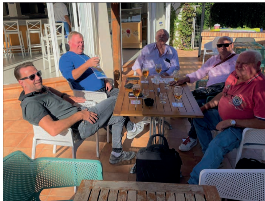
Die 50. Tour führte die Sermer Kegelbrüder wieder nach Mallorca, in 2022.

Und 2023? „Wir fahren in unserem Alter nicht mehr auf Kegelrunde. Wir machen einen Wellness-Urlaub im wunderschönen Seebad Les Maraveals auf der Sonneninsel Mallorca. So kann es noch einige Jahre weitergehen. GUT HOLZ!“ sam