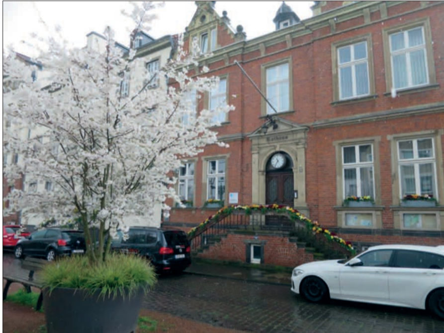
Man sollte nicht nur auf das bucklige (immerhin historische) Pflaster auf dem Kaiserswerther Markt gucken, sondern auch, wie es dort rundum wunderbar blüht.

nen) finden, die das Gießen und Pflegen (Unkraut und Müll entfernen) im Sommer übernehmen. Die Kübel werden im Juni bepflanzt vom Gartenamt angeliefert und im Herbst wieder abgeholt. Wer eine oder mehrere Patenschaften übernehmen möchte, darf Standorte vorschlagen und ist gebeten, sich bis spätestens 21. April bei der Bezirksverwaltungsstelle 5, Tel. 0211 8993015 oder per E-Mail bezirksverwaltungsstelle05@duesseldorf.de zu melden. H.S.