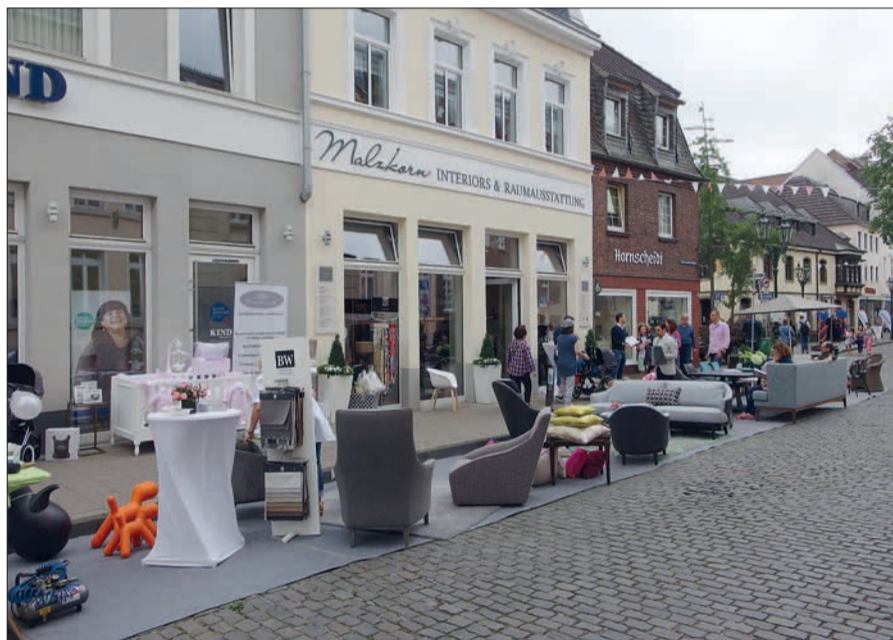
Die Vielfalt von Einzelhandel, Kultur und Geschichte zeigt sich bei der Kaiserswerther Sommernacht.