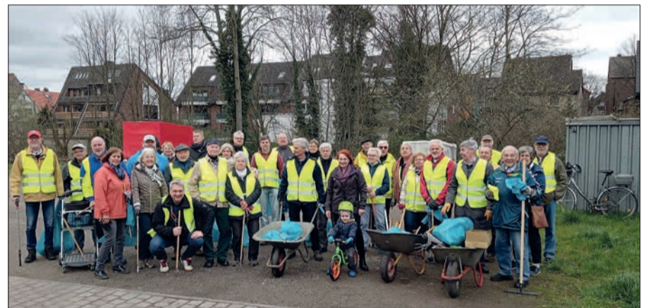
Huckingen ist wieder sauber! Mehr als 30 Personen haben Ende März beim Putztag des Bürgervereins Huckingen mitgeholfen, den Ort von Unrat zu befreien.