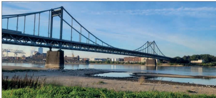
Die Rheinbrücke bei Uerdingen stellt eine wichtige Verbindung zwischen den Städten Duisburg und Krefeld dar. Sie muss neu gebaut werden.

Wer aus dem Duisburger Süden oder Düsseldorfer Norden auf die westliche Rheinseite möchte, benutzt oft die B 288 – und damit die Rheinbrücke in Krefeld-Uerdingen. Nach fast 100 Jahren in Betrieb muss diese Rheinbrücke Anfang der 2030er-Jahre durch ein neues Bauwerk ersetzt werden. Brücken-Nachrechnung und Materialprüfung machen diesen Schritt notwendig, teilt Straßen.NRW mit. Bis dahin sollen umfangreiche Kompensationsmaßnahmen dafür sorgen, dass Verkehrsteilnehmende die Brücke gefahrlos passieren können. Eine im März 2023 durchgeführte Untersuchung habe gezeigt, dass das in der damaligen Zeit verwendete Baumaterial schlechtere