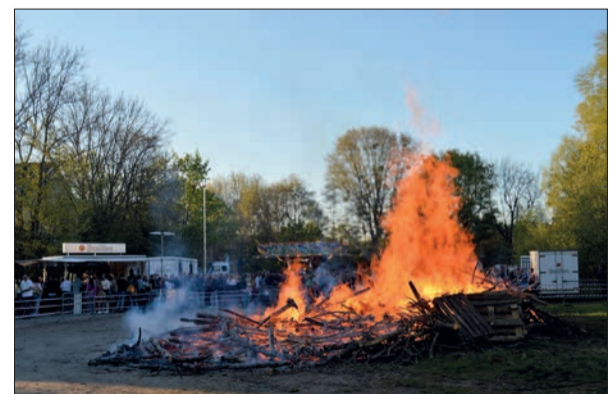
Mehr als 1.000 Gäste waren im vorigen Jahr beim Osterfeuer in Huckingen.

Zum „Osterfeuer in Huckingen“ lädt die St. Sebastianus Schützenbruderschaft im Ort ein. Es wird am Ostersonntag, 9. April, um 17 Uhr auf dem Schützenplatz im „Ährenfeld“ angezündet. Bis 22 Uhr sorgen die Schützen für Speise und Getränke. Auch ein Kinderkarussell wird aufgebaut. Ein WC steht vor Ort. „Wir freuen uns auf die Huckinger Bürger, Freunde und Nachbarn aus allen Ortsteilen!“, so die Huckinger Schützen. Das „Rahmer Osterfeuer“ entzünden die Pfadfinder des Ortes am Ostersonntag, um 19.45 Uhr hinter dem Pfarrheim. Wie jedes Jahr stehen Getränke und ein kleiner Snack bereit. sam