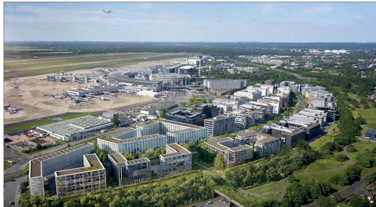
Der Lohausener Flughafen „DUS International“ aus der Vogelperspektive. Im Vordergrund die Airport-City.

Aber auch die Entwicklung von Lohausen in den letzten 20 bis 30 Jahren ist eine Erfolgsgeschichte. Arbeitsplätze in neuen Gewerbegebieten, vielseitige Einkaufsmöglichkeiten über den täglichen Bedarf hinaus und Gastronomie rund um den Verkehrskreislauf und entlang der Niederrheinstraße, Erweiterung der Grundschule und weiterer Kindergärten,