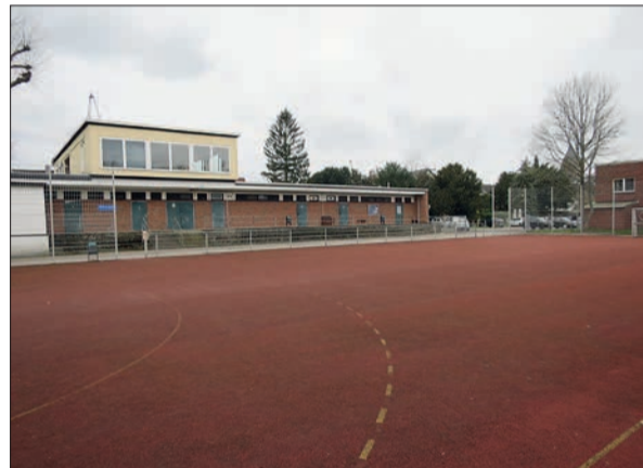
Die Bezirkssportanlage in Angermund (Teilansicht). Im Vordergrund das Kleinspielfeld.

Halle mit Gastronomie, als Schützen- und Festplatz, allgemeiner Parkplatz- und Wanderparkplatz, Standort für Recyclingcontainer und Zufahrt zur freiwilligen Feuerwehr keine Augenweide. Die großen Bäume wurden im vergangenen Winter entfernt, die großen Pfützen, eher schon kleine Teiche nach jedem Regen, sind geblieben. Für die ehemalige „Stadt und Freiheit Angermund“ wäre eine umfassende Aufbesserung dieses „Hinterhofes“ angemessen. Ob der Oberbürgermeister diesen Platz endlich mal zur Chefsache macht, wenn schon die Planungsabteilung und der Stadtentwässerungsbetrieb dies nicht tun,