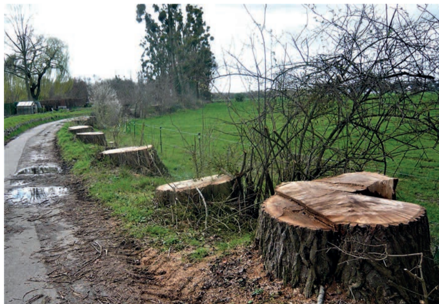
Von hier bis zu den noch stehenden Bäumen sind die Pappeln gefällt worden. Ade Romantik – willkommen in der Realität.

ein Mitarbeiter des Sportamtes. Außerdem waren diese Bäume auch noch mit dem Totholzpilz befallen, so dass sie letztendlich entfernt werden mussten. Eine traurige Geschichte. Mit der Planung von neuen Windkraftanlagen hat dies aber wohl (noch) nichts zu tun.